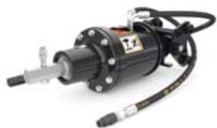
WIERTNICA CAT® A7B Nr kat. 218-3206