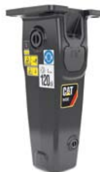
ZESTAW MŁOTA HYDRAULICZNEGO CAT® H45E S Nr kat. 561-2549