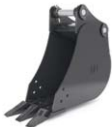
ŁYŻKA KOPIĄCA CAT® 300mm - Nr kat. 147-1018 400mm - Nr kat. 147-1020