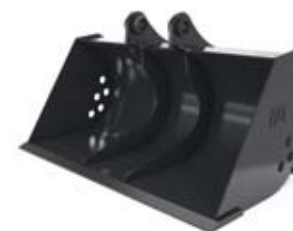
ŁYŻKA SKARPOWA CAT® 800mm - Nr kat. - 147-1029 1000mm - Nr kat. 147-1031