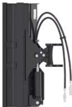
ŁYŻKA SKARPOWA HYDRAULICZNA CAT® 1000mm Nr kat. 244-3073