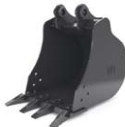
ŁYŻKA KOPIĄCA CAT® 500mm - Nr kat. 147-1023 600mm - Nr kat. 147-1026